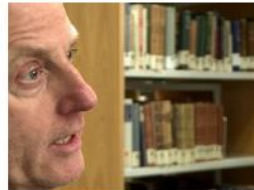
Documenting and citing sources in a Danish academic context