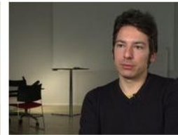
What surprised you the most about coming to Aarhus University?