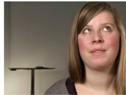
What was the most different thing about coming to Aarhus University?