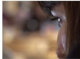
Group Work at Aarhus University

Albums can also be used to show videos on other web sites using Vimeo Widgets.