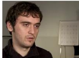
What has been your best learning experience at Aarhus University?