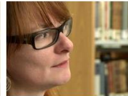
Feedback among lecturers: Peer review